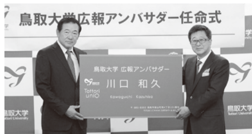
特大名刺もお渡ししました！