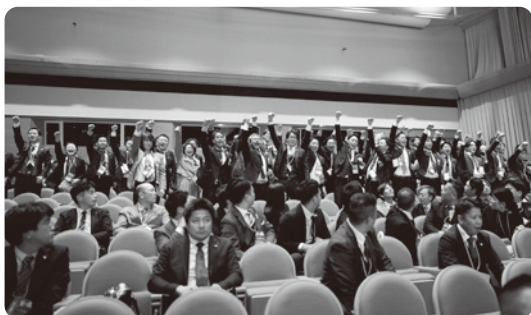
拳を突き上げるメンバー