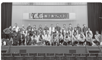
参加したメンバー