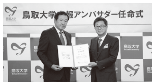
任命状授与の様子

鳥取大学では、今後も広報アンバサダーをはじめとする多様な連携を通じて、大学と地域が共に発展する取り組みを推進しながら、本学の魅力を積極的に発信してまいります。