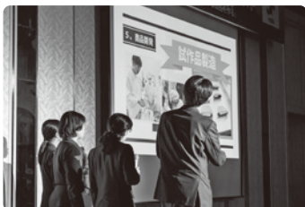
熱意ある発表をする高校生