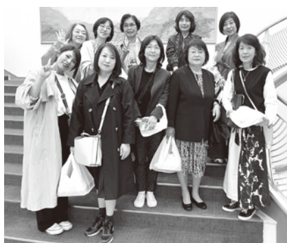
参加会員の集合写真

や制作資料を通じて、創作に込められた情熱と独創性を学ぶことができ、これらの体験は、鳥取大会の企画づくりにおいて大いに参考となるものであり、会員からも多くの気づきが寄せられました。帰路のバスでは、研修を通じて得た感想や、大会に向けた意見交換が活発に行われ、有意義な時間となりました。