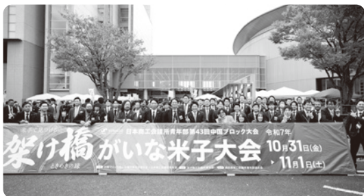
参加したメンバー