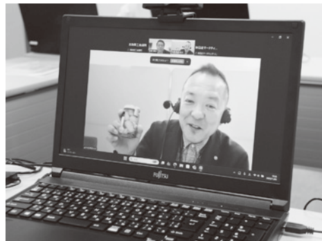
オンラインで商談する様子

員事業所と首都圏バイヤーの各社をオンラインでつないで食品商談会を開き、12社が自社の商品売り込みました。