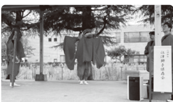
麒麟獅子舞の演舞