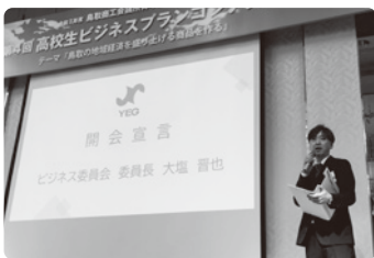
大塩委員長による開会宣言