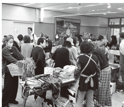
販わうバザー会場

令和7年11月13日(木)、錦秋のこの時期の恒例行事となつて、いるチャリティーバザーを鳥取産業会館・鳥取商工会議所ビル1階ホールで開催しました。