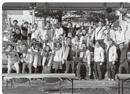
参加したメンバー