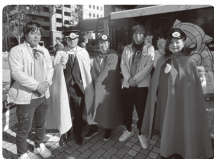
交通戦隊へ変身したメンバー